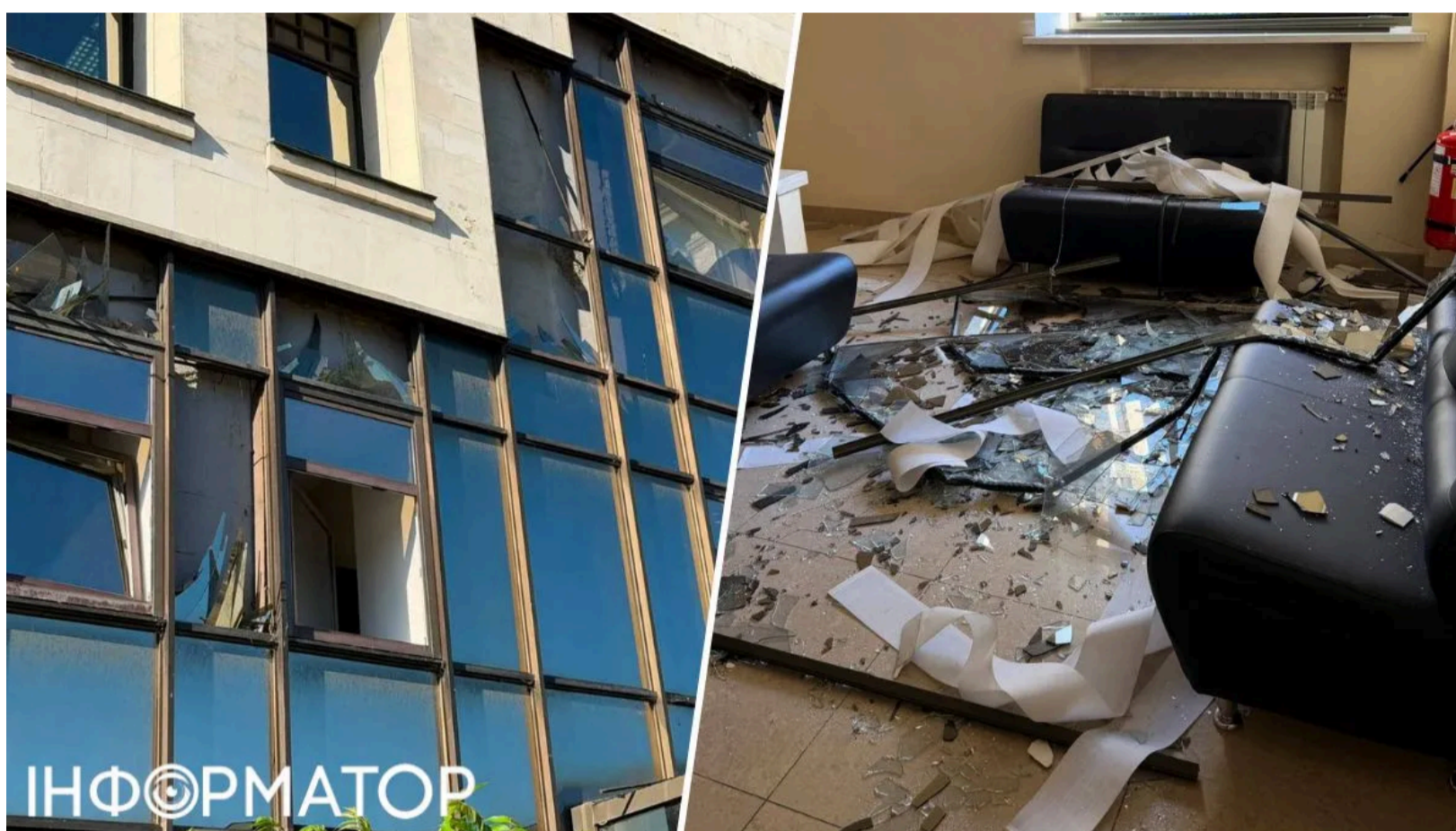
ВАКС постраждав від нічного удару РФ

Нічна масована атака Росії на Київ пошкодила будівлю Вищого антикорупційного суду на проспекті Берестейському, 41. У ніч проти 15 червня ворог застосував понад 680 засобів повітряного нападу, основний удар припав на столицю . У будівлі суду вибило вікна, співробітники встановлюють повний обсяг пошкоджень. Попри інцидент, ВАКС підтвердив: усі заплановані засідання відбудуться за графіком.