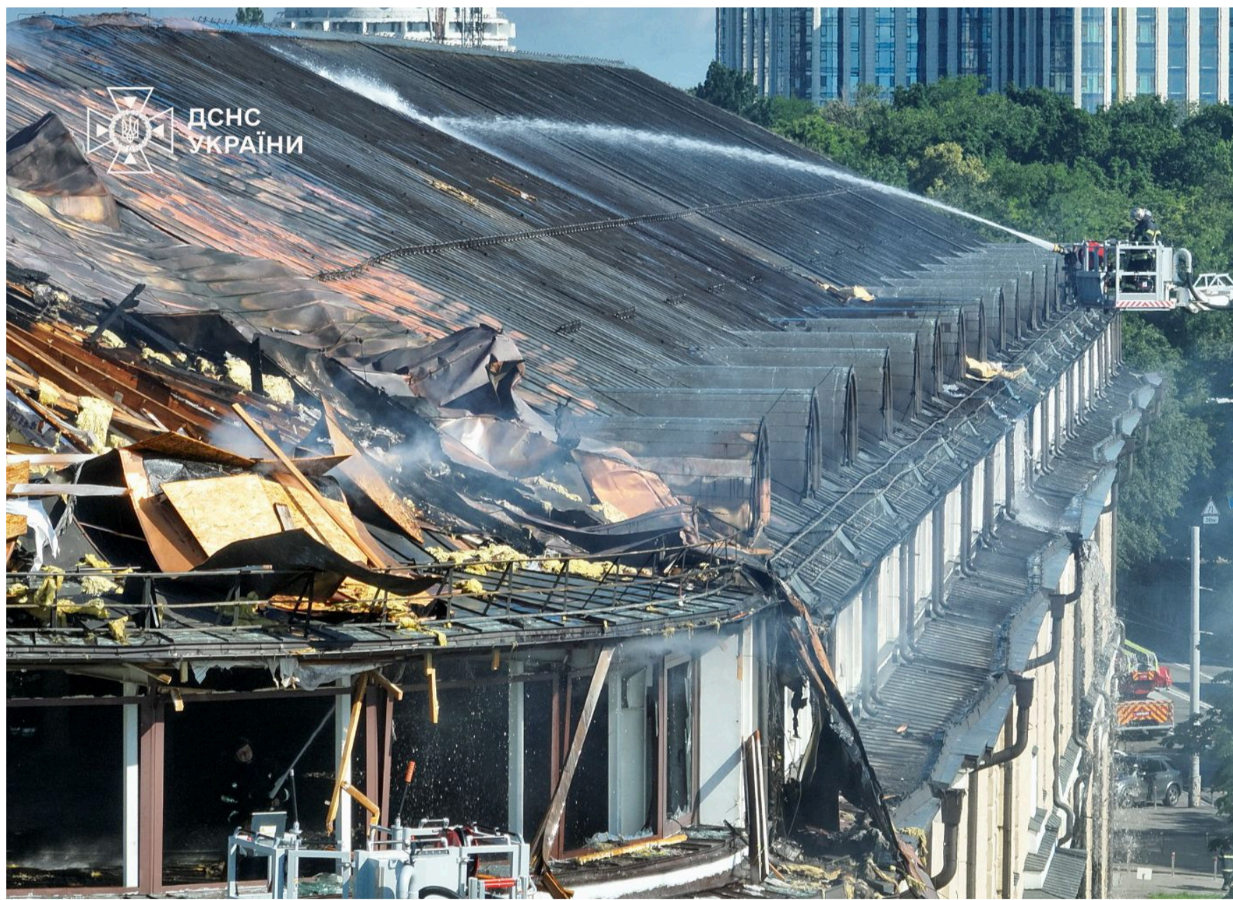
Понівечена Києво-Печерська Лавра після нічного обстрілу.

- Вони таким чином намагаються духовно нас зламати. Але ми пройдемо ці випробування. Цей собор неодноразово в історії бачив руйнації, та ми відновимо все, - сказав предстоятель ПЦУ.