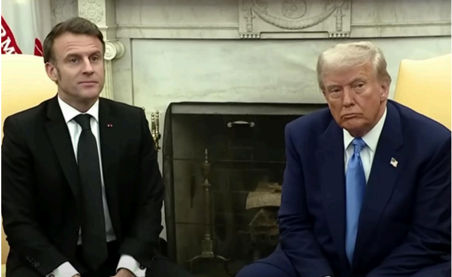
Макрон намагатиметься всіляко догодити Трампу / скріншот із відео

Очікування від саміту невисокі, і мета полягає в тому, щоб утримати Трампа в переговорах щодо України.