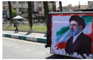
Спочатку гроші, потім переговори: Іран висунув Трампу умову 05:56

Як Brent, так і WTI у понеділок подешевшали до мінімумів із 10 березня.