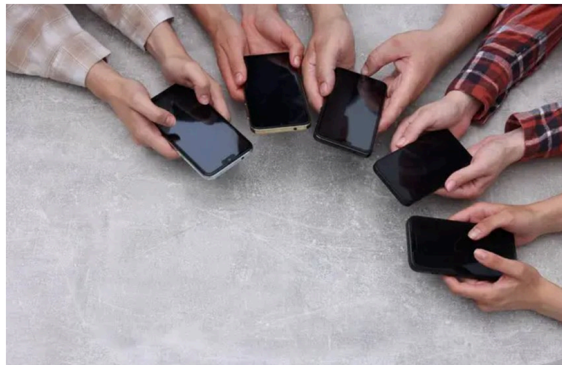
Росіяни заводять другий телефон

Безпрецедентне посилення інтернет-цензури в Росії змусило росіян пристосовуватися: носити два телефони, жонглювати VPN-сервісами та роздільно тримати державні і приватні застосунки.