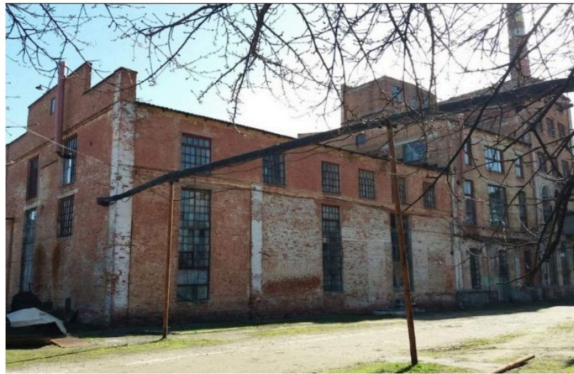
Фонд держмайна виставив на аукціон Дублянський спиртзавод / ФДМУ

Фонд державного майна України (ФДМУ) виставив на приватизацію єдиний майновий комплекс (ЕМК) державного підприємства "Дублянський спиртовий завод", розташований у Харківській області.