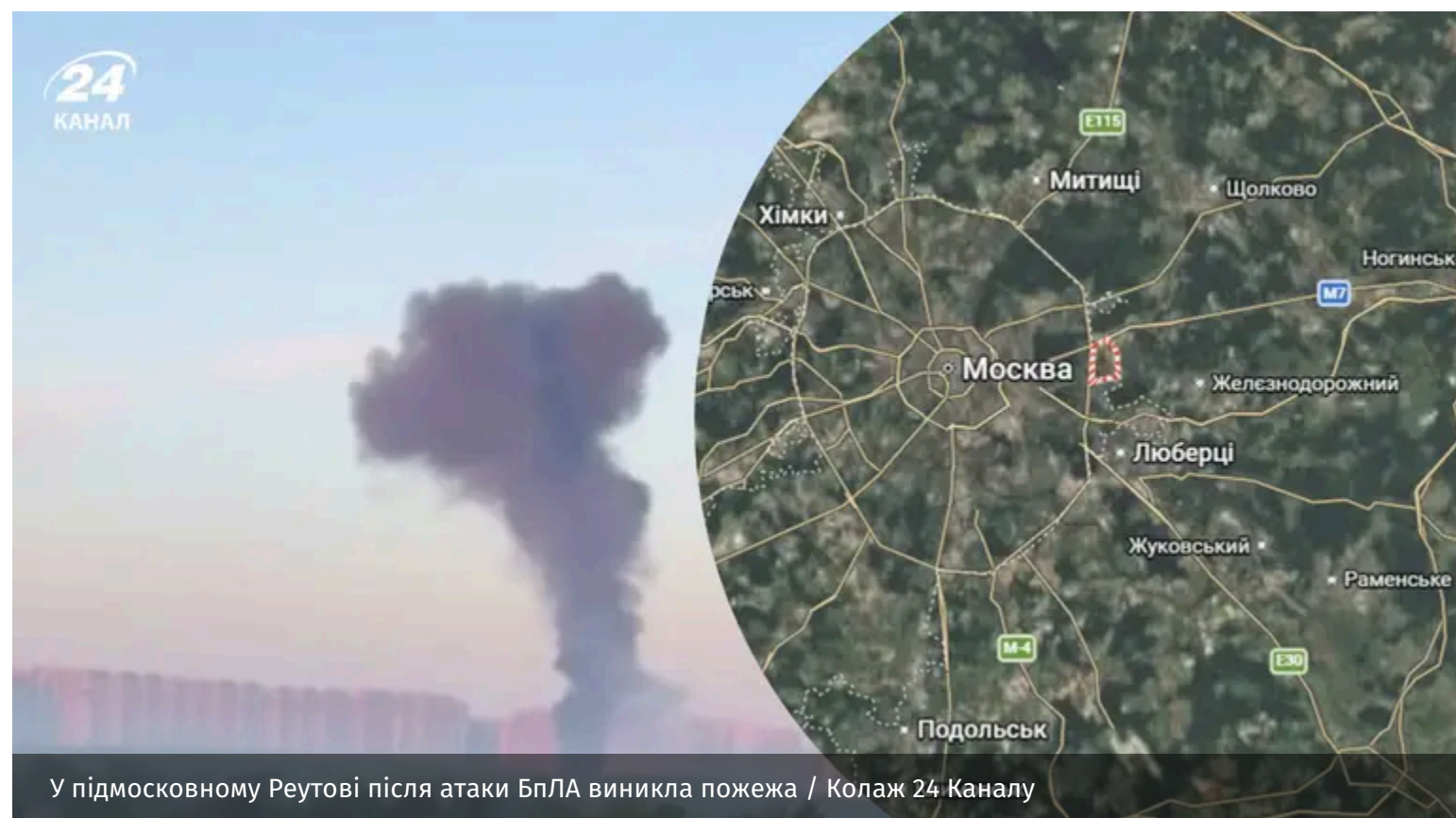
У підмосковному Реутові після атаки БПЛА виникла пожежа

У підмосковному Реутові після атаки БПЛА виникла пожежа приблизно за 600 метрів від АТ "ВПК "НВО машинобудування". Це розробник гіперзвукових ракет "Циркон" та стратегічного ракетного комплексу "Авангард".