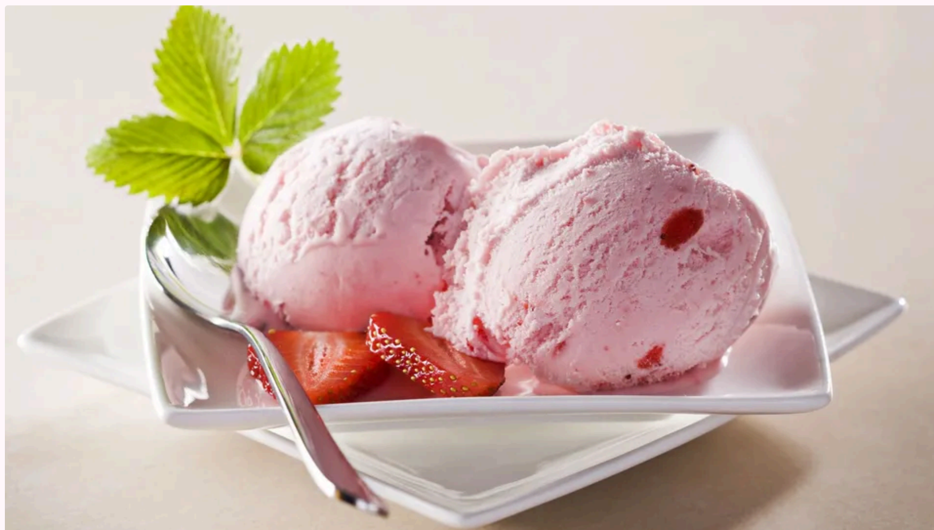
Такий десерт освіжить у спеку

У сезон полуниці варто приготувати домашнє морозиво з додаванням цих ягід. Рецептот поділилося видання Shuba.