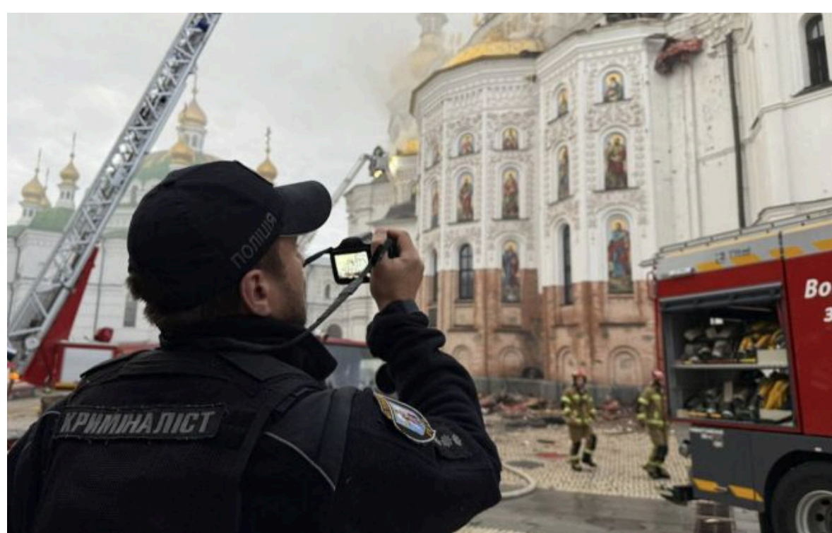
Фото: наслідки ворожої атаки по Києву (facebook.com/UA National Police)