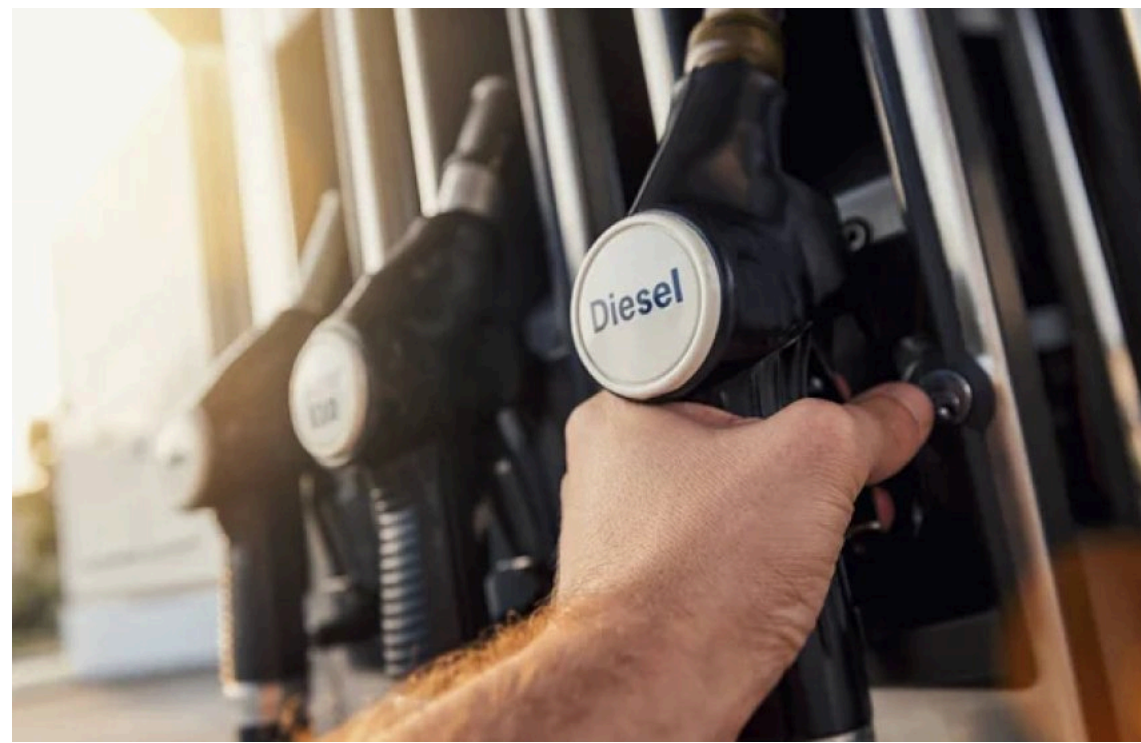
Британія припинить імпорт дизеля та авіапального з РФ

Велика Британія оголосила про встановлення чітких термінів повної заборони на імпорт дизельного та авіаційного палива, виготовленого з російської нафти.