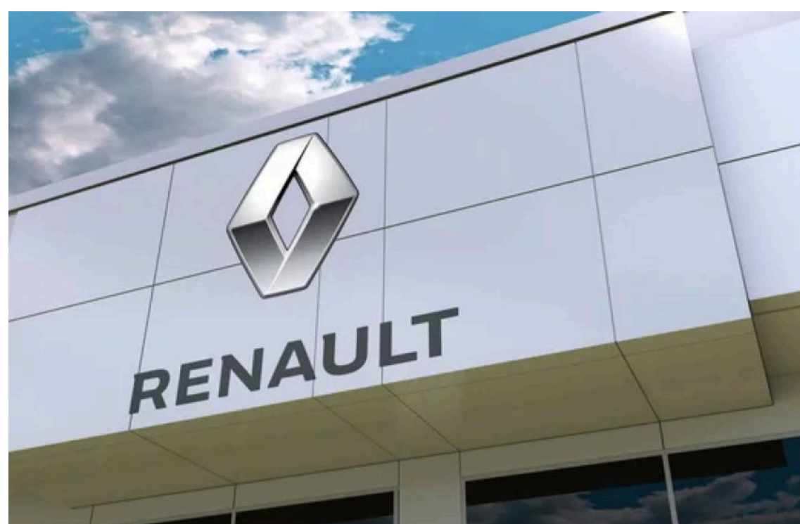
Renault планує розробити новий військовий позашляховик

Французький автомобільний концерн Renault Group у партнерстві з оборонно-технологічною компанією Thales розпочинає розробку багатощільового військового автомобіля. Проект стане частиною європейських зусиль із переозброєння.