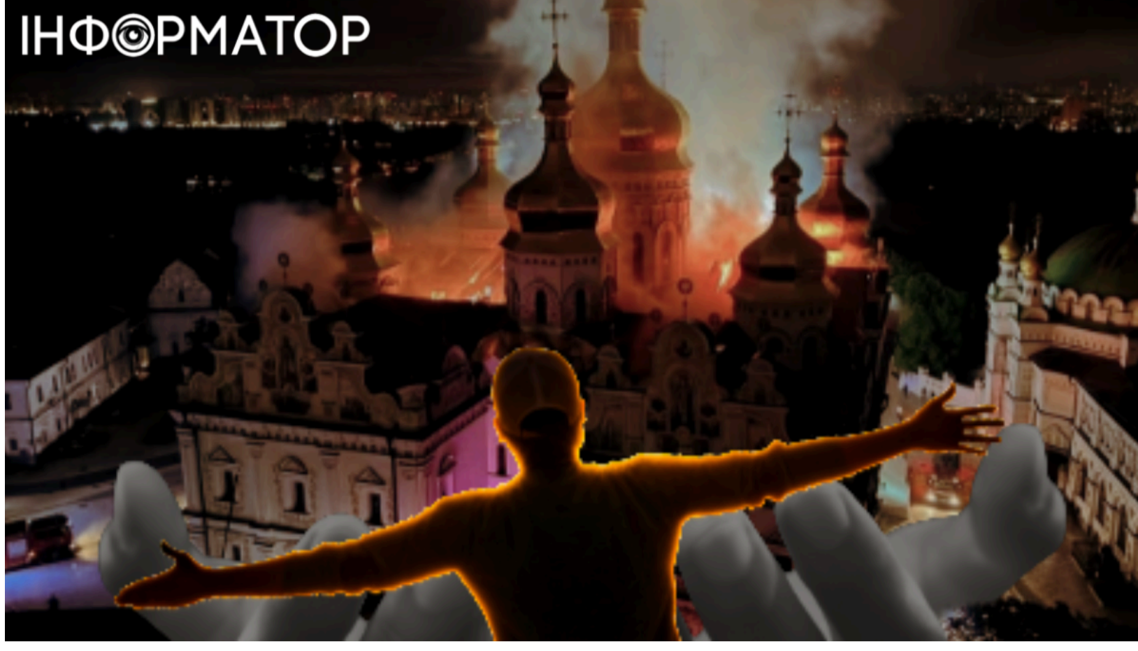
Росія вдарила по душі України.

Росія завдала одного з наймасованіших комбінованих ударів по Україні в ніч на 15 червня - епіцентром атаки стала столиця. Тут снаряди влучили у Свято-Успенський собор Києво-Печерської лаври , коледж і костюмний склад кіностудії Довженка. Двома тижнями раніше удар по Києву також забрав життя і поранив десятки людей, але таких руйнувань культурних об'єктів не було.