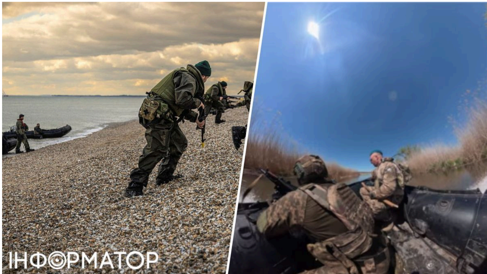
Морпіхи ЗСУ взяли острови між Херсоном

Українські морські піхотинці витіснили росіян з ключових островів у дельті Дніпра між Херсоном і тимчасово окупованими Олешками. Ще на початку року ЗСУ змусили окупантів частково відступити з укріплень на Олексіївському острові поблизу цього міста. Тепер ситуація на острівній ділянці змінилася докорінно - на користь України.