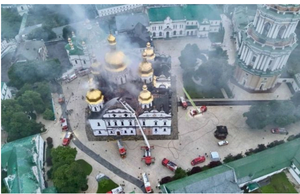
Фото: Епіфаній і Сибіга відреагували на пошкодження Лаври після нічного обстрілу Києва ( https://t.me/dsns_telegram )