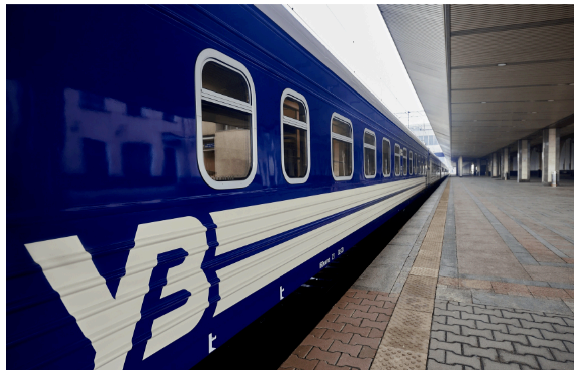
Укрзалізниця попередила про затримку низки поїздів

"Укрзалізниця" попередила, що низка поїздів в Україні йде із запізненнями через нічні удари. Найбільші затримки – від трьох до майже чотирьох годин.