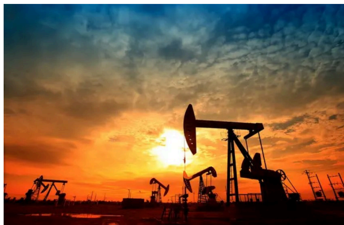
Світові ціни на нафту впали до найнижчого рівня

Станом на 15 червня 2026 року ціна нафти Brent становить $88,22 за барель, WTI – $85,42, а Urals – $78,39. Ціни знизилися на тлі заяв президента США Дональда Трампа та заступника глави МЗС Ірану про попередні домовленості щодо завершення війни та відновлення судноплавства в Ормузькій протоці.