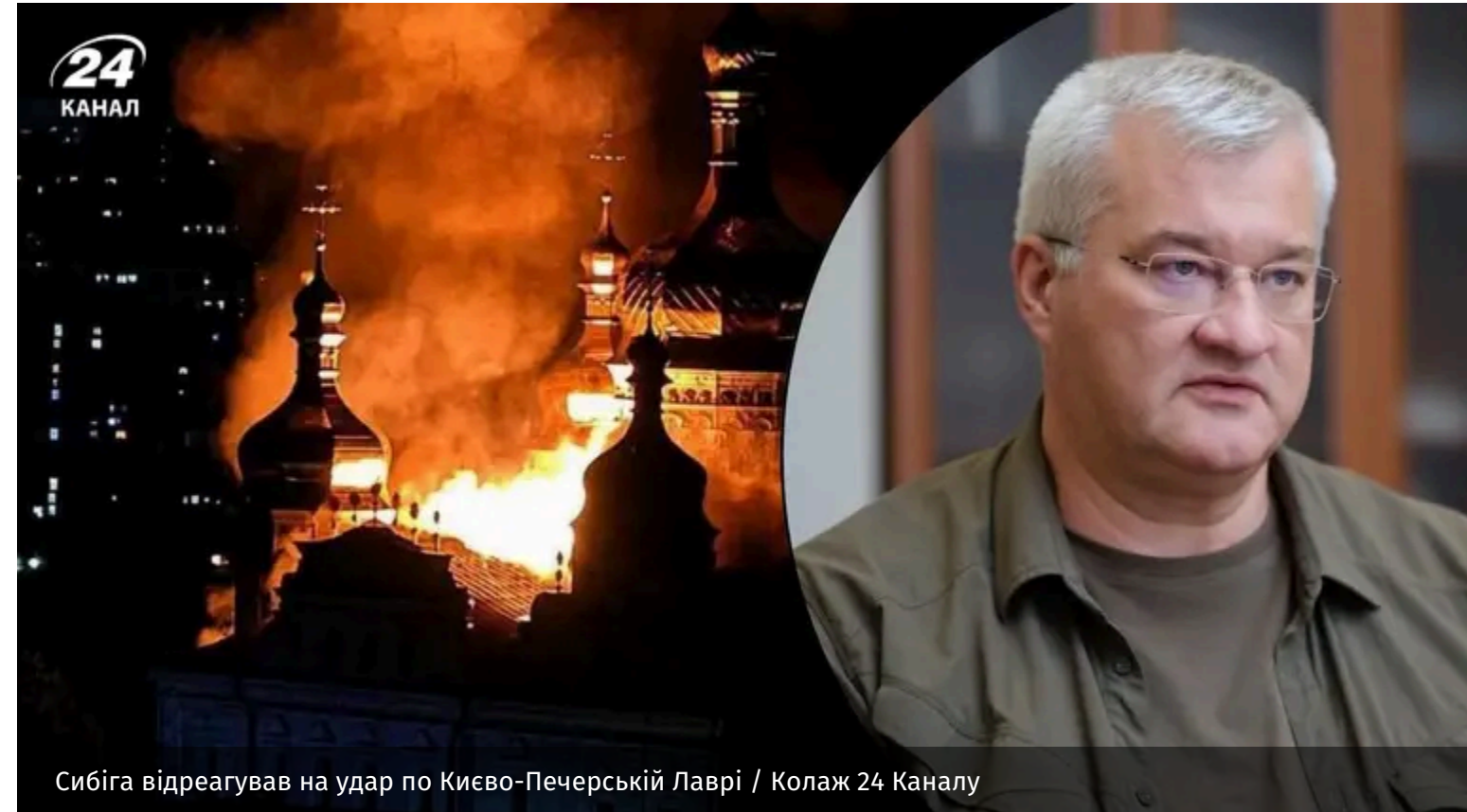
Сибіга відреагував на удар по Києво-Печерській Лаврі / Колаж 24 Каналу

Міністр закордонних справ України Андрій Сибіга відреагував на пошкодження Києво-Печерської лаври внаслідок російської атаки. Він заявив, що Україна ініціює міжнародні механізми реагування та очікує рішучих дій від світової спільноти