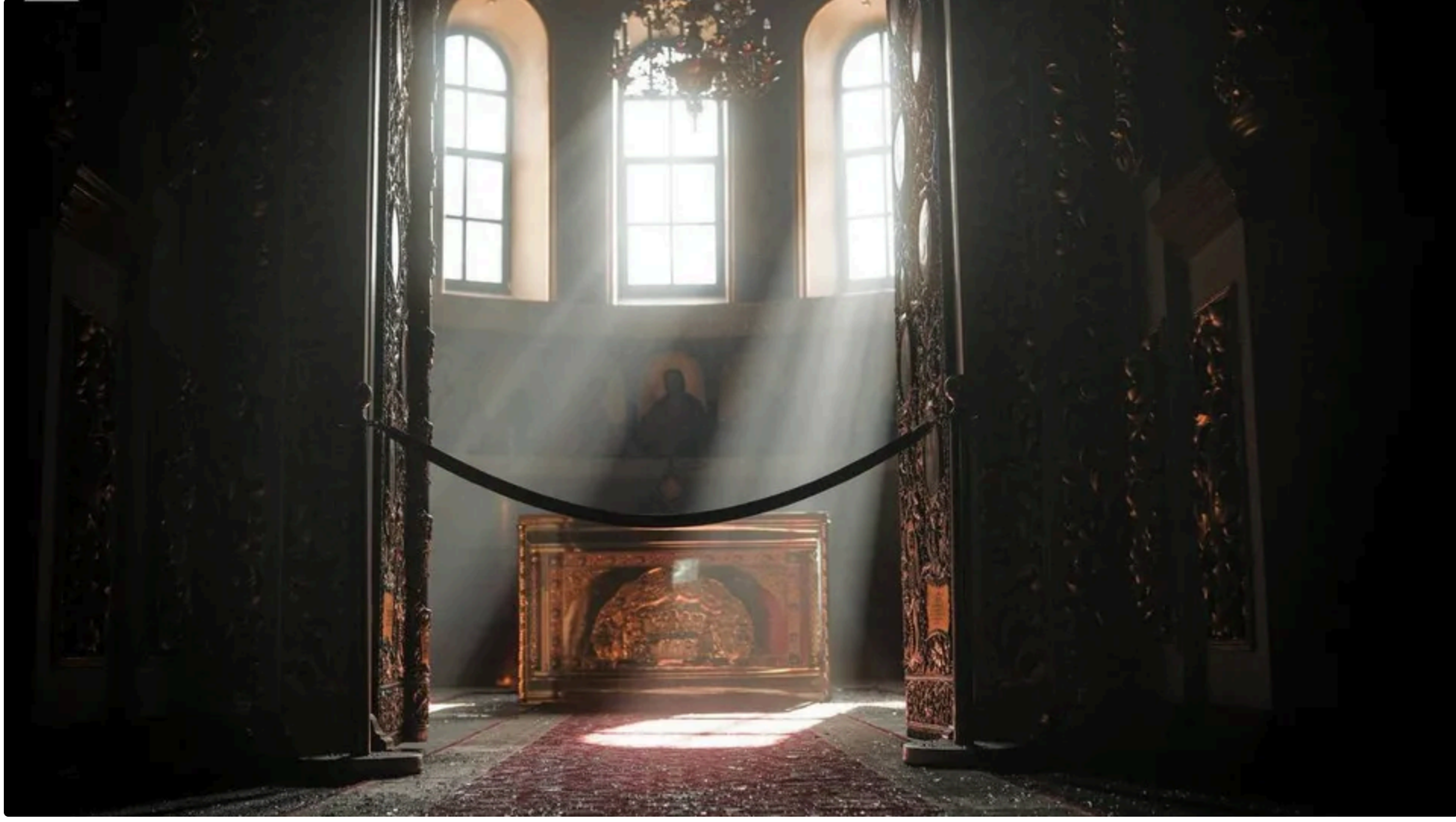
Shahed влучив у вітарну частину Успенського собору – в Стефанівській приділ

Унаслідок атаки країни-агресора РФ у ніч на 15 червня пошкоджено Києво-Печерську Лавру, зокрема на даху Успенського собору виникло займання. Про це в соцмережі X повідомив предстоятель Православної церкви України митрополит Епіфаній.