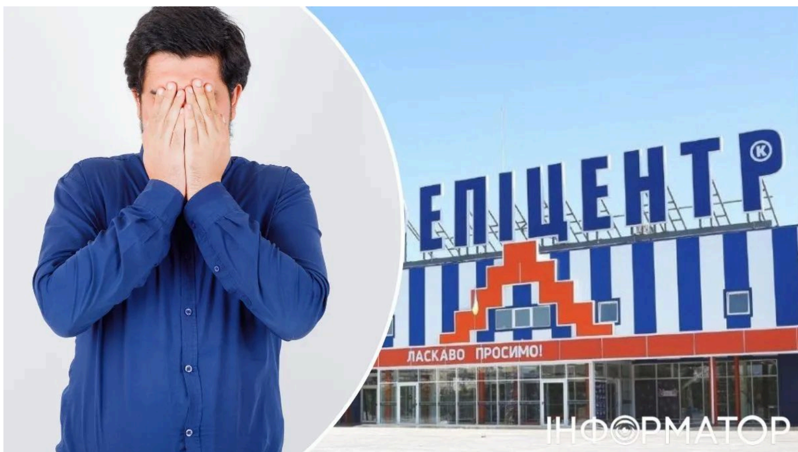
Крадіжка в Епіцентрі - рецидивіст отримав 5 років

Мешканець Кривого Рогу з десятима попередніми судимостями отримав 5 років і 3 місяці позбавлення волі за серію крадіжок спортивного одягу в магазинах "Епіцентр" та "Атлетікс" під час воєнного стану. Схожий випадок крадіжки товарів у мережі Епіцентр фіксували і раніше - суди дедалі жорсткіше реагують на подібні злочини проти ритейлу. Чоловік визнав провину та уклав угоду з прокурором. Суд затвердив угоду про визнання винуватості 1 червня 2026 року.