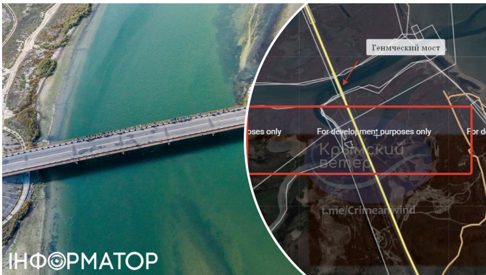
Два маршрути до Криму перекрили після ударів

Нічні удари безпілотників знову зупинили рух одразу на двох ключових шляхах до окупованого Криму . Тепловізійні сигнатури зафіксовано в районі з'їзду з моста, що з'єднує Генічеськ з Арабатською стрілкою. Рух у бік пункту пропуску "Джанкой" повністю перекрито після ударів поблизу Чонгара. Перший удар по Чонгарському мосту стався 7 червня, після чого рух вдалося відновити лише в реверсивному режимі.