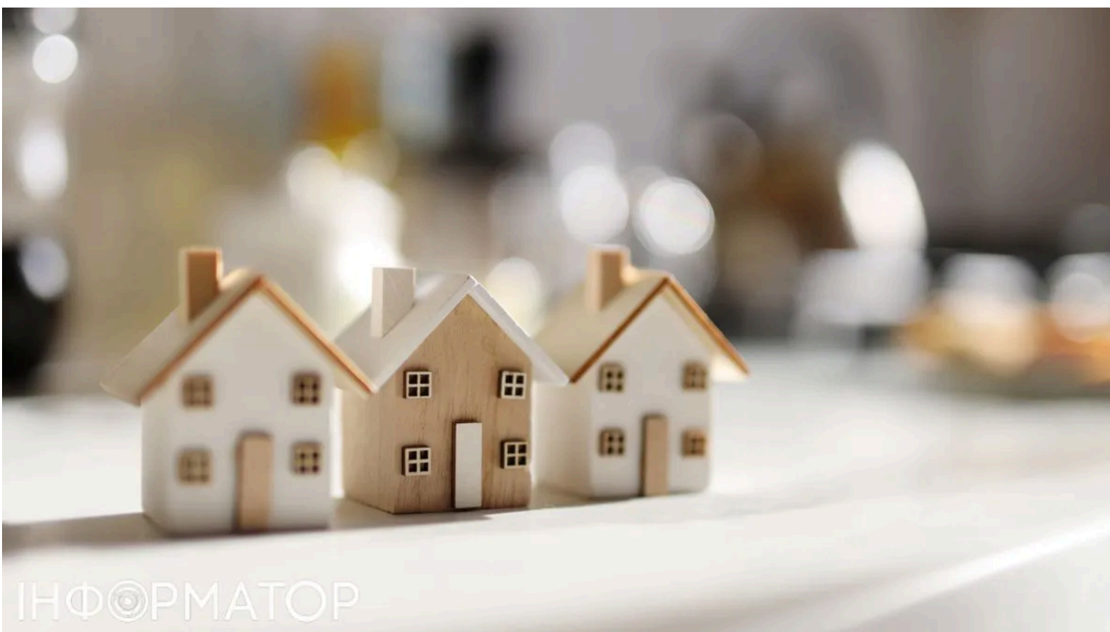
Будиночок в селі

Переселенці, які втратили домівки через війну або вимушено залишили окуповані території, отримають можливість тимчасово жити у сільських будинках. Уряд раніше вже ухвалював рішення щодо житла для ВПО , і цього разу запустив окремий експериментальний механізм для сільської місцевості. Постанову підписано 10 червня 2026 року. Програма спрямована на інтеграцію ВПО у нових громадах і охоплює як тих, хто втратив житло, так і тих, чиє майно пошкоджено до ступеня непридатності для проживання.