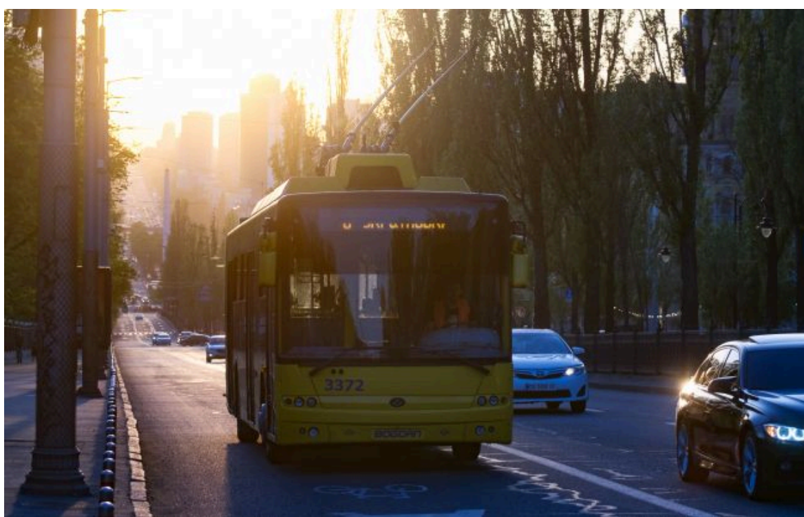
Фото: у Києві змінено рух транспорту після атаки