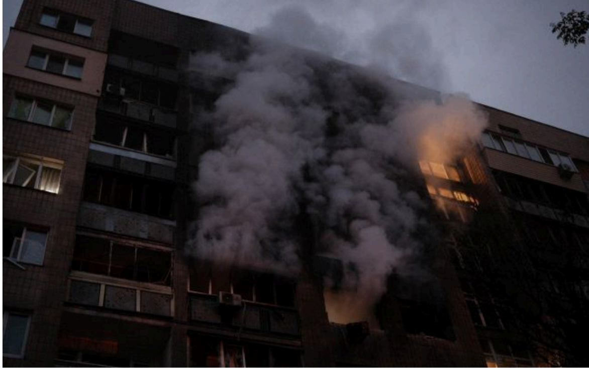
Фото: наслідки атаки на Київ