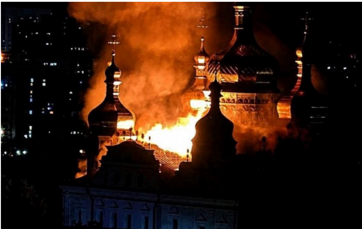
Пожежа в Успенському соборі Києво-Печерської лаври

Речник ПС закликав українців не публікувати у соцмережах фотографії уламків ракет, оскільки такі матеріали використовує російська пропаганда.