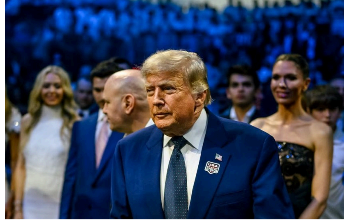
Donald Trump

Президент США Дональд Трамп заявив, що Вашингтон досяг угоди з Іраном, внаслідок якої Ормузька протока буде знову відкрита для міжнародного судноплавства