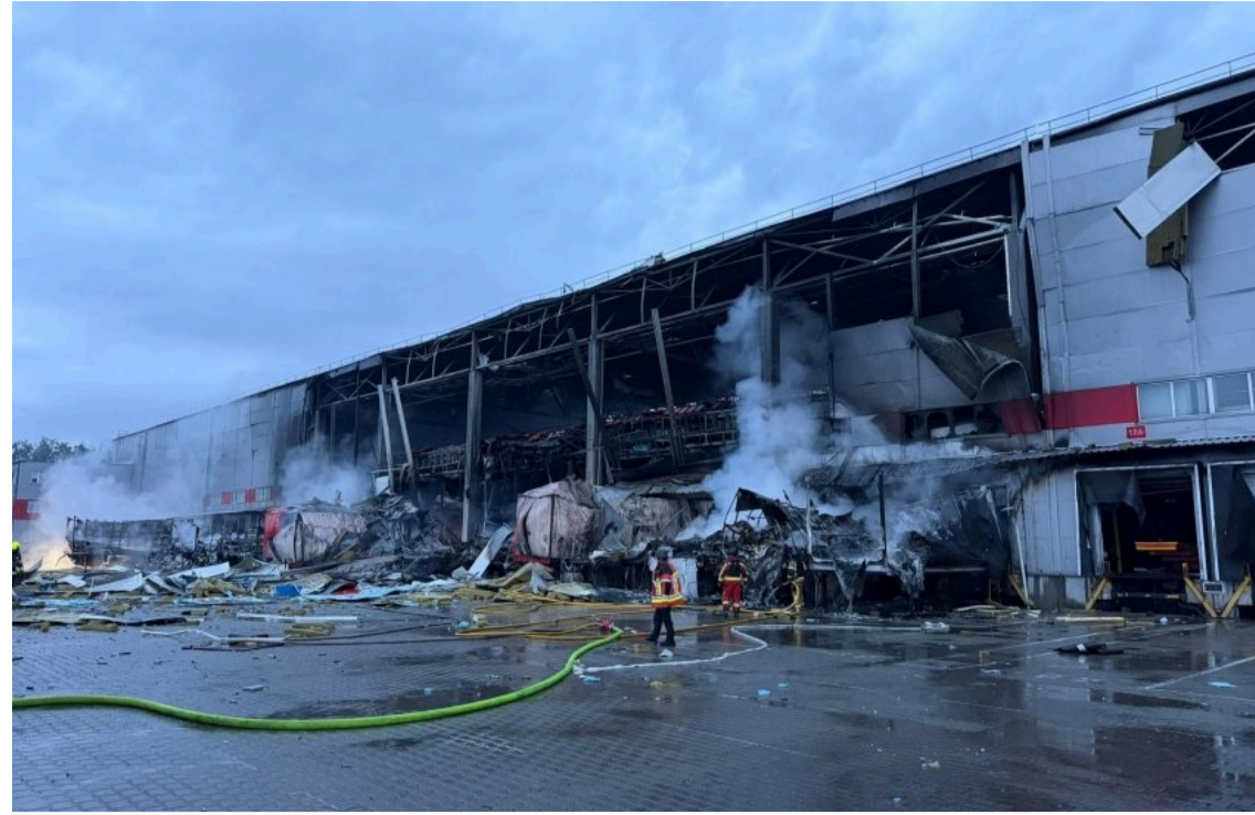
Знищено найбільший сортувальний центр "Нової пошти".

15 червня внаслідок чергової ракетної атаки російської армії було знищено найбільший інноваційний термінал логістичної компанії "Нова пошта" у Києві.