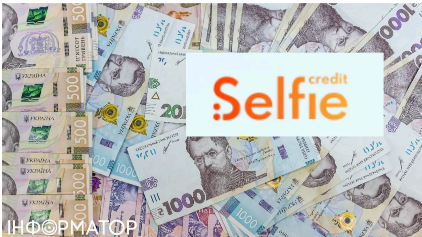
Мікрофінансова компанія "Селфі Кредит"

Корюківський районний суд Чернігівської області задовольнив позов факторингової компанії і стягнув з боржника понад 38 тисяч гривень - за мікропозикку розміром 6100 гривень, яку людина не повернула. Подібні справи - не рідкість: в Ічнянському районному суді Чернігівщини також розглядали спір про примусове стягнення кредитного боргу , де чоловік відмовлявся визнавати заборгованість перед банком. Рішення у справі № 736/177/26 ухвалив суддя Юрій Кутовий 1 червня 2026 року. Загальна сума, яку суд зобов'язав виплатити відповідача, сягнула майже 49 тисяч гривень - з урахуванням судового збору та витрат на правничу допомогу.