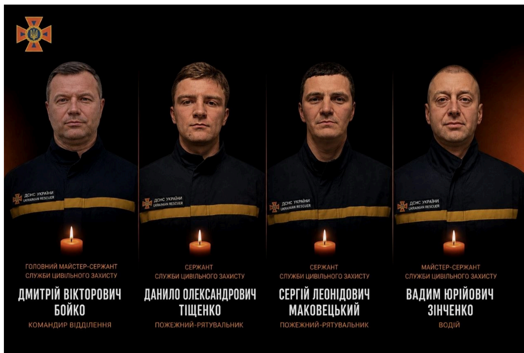
Росіяни вбили 4 рятувальників.

Крім загиблих, є поранені: від повторного удару поранені щонайменше 5 співробітників служби, у них поранення різного ступеня важкості. Наразі лікарі надають їм усю необхідну медичну допомогу.