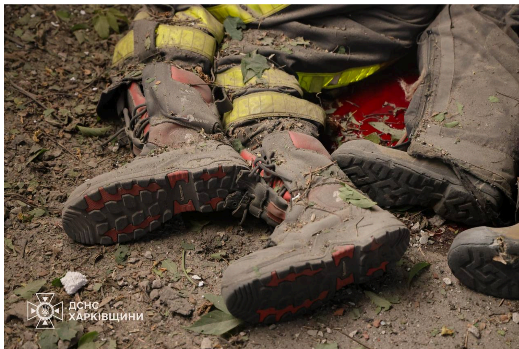
Удар забрав життя 5 рятувальників.

Удар став частиною великої комбінованої атаки на Україну. Під основним ударом також перебуває столиця, де зафіксовано значні руйнування цивільної інфраструктури.