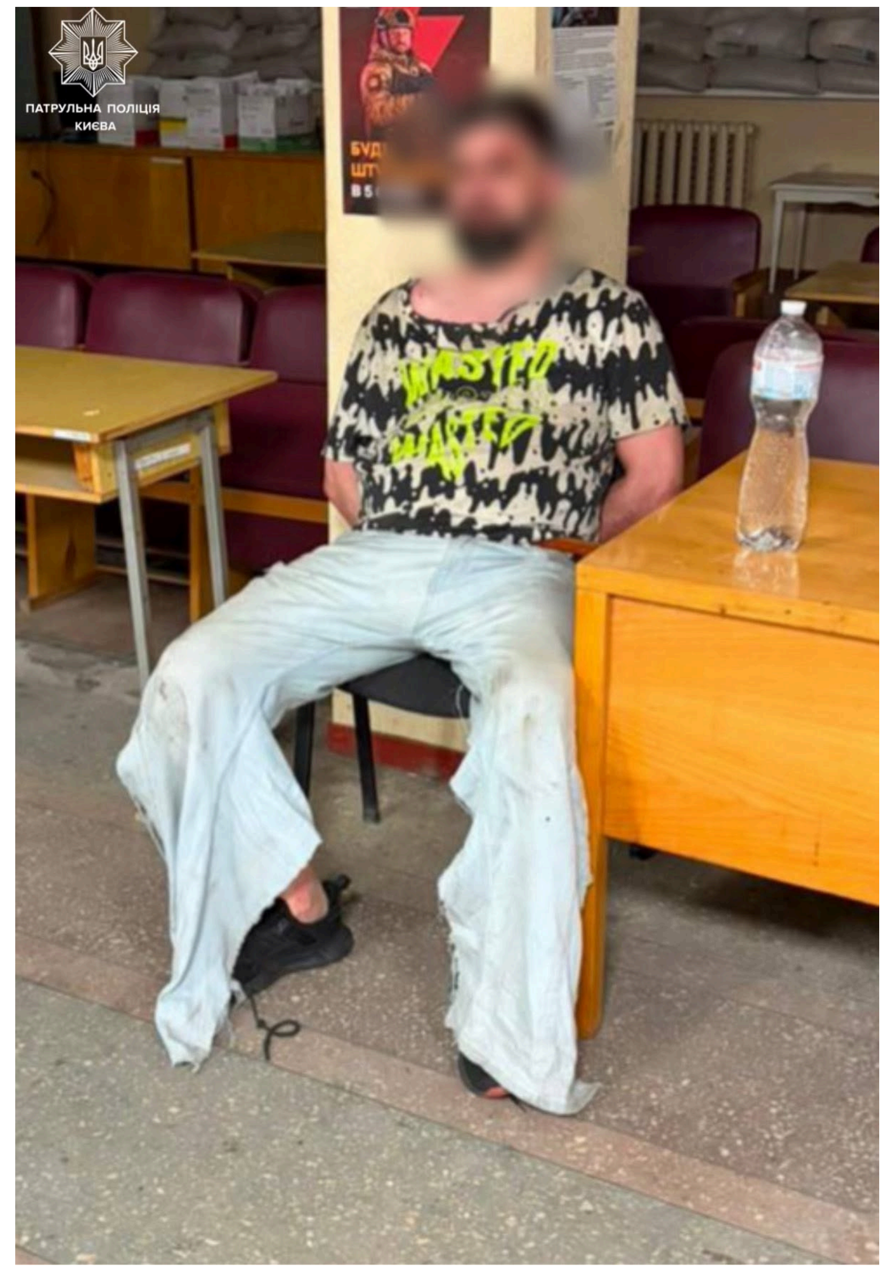
Водія затримали.

На водія винесли постанову за заклеєні номери та склали протокол за ігнорування вимоги про зупинку. Втікачу інкримінують статтю Кримінального кодексу України за погрозу або насильство щодо працівника правоохоронного органу. Крім того, під час перевірки бази даних з'ясувалося, що водій перебуває у розшуку як порушник мобілізаційного законодавства. Після оформлення всіх процесуальних документів правопорушника офіційно передали до районного ТЦК та СП.