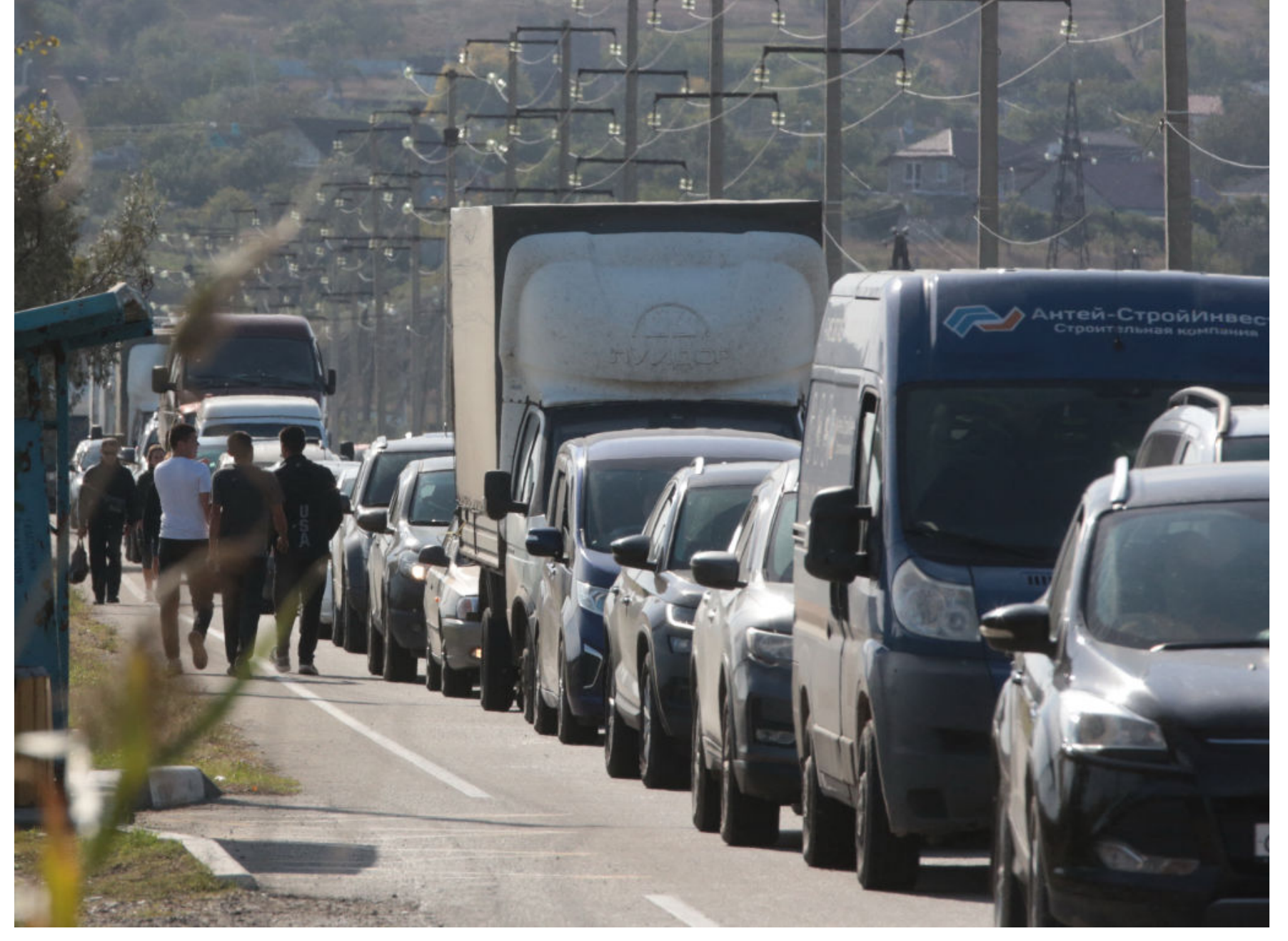
Кілометрові черги в Криму до заправок стали буденністю.

З іншого боку, блокада та зростаючий всеохопний локдаун на півострові створюють критичний економічний та гуманітарний тиск на окупантів. У Криму вже зараз запроваджено жорсткі обмеження на продаж продуктів в одні руки (крупи, борошно, цукор), а вільний продаж бензину цивільним повністю зупинено. Крім цього, інфраструктурний колапс остаточно знищує туристичну сферу, яка є основою економіки півострова, змушуючи Кремль витратити колосальні ресурси на утримання регіону.