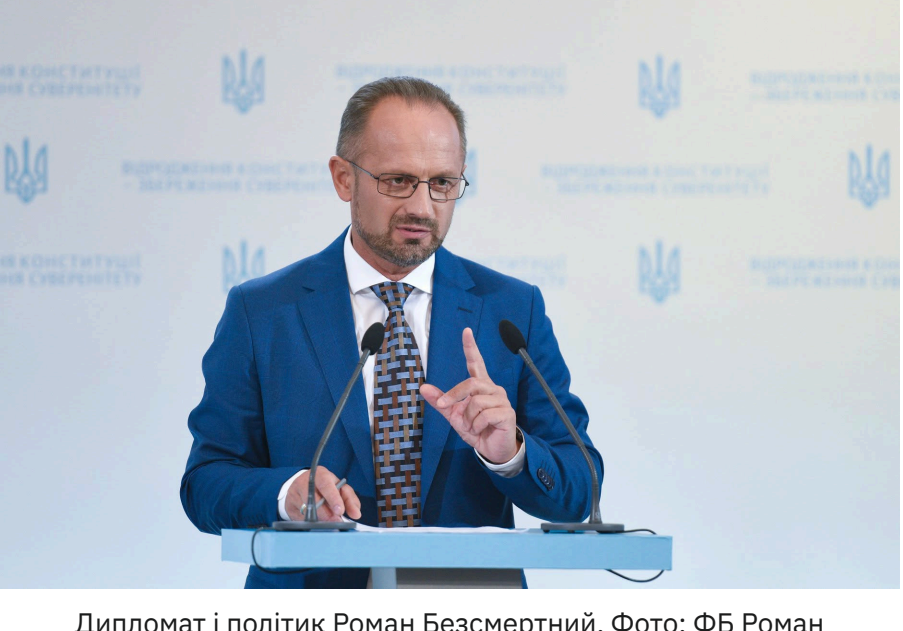
Дипломат і політик Роман Безсмертний.

Дипломатичний кейс блокади полягає в посиленні позицій Києва на переговорах із Москвою. Україна таким чином повернула проти росіян їхню улюблену стратегію — «примус до миру» і створила умови для чергового їхнього «жесту доброї волі». Адже утримання Криму поступово стає для РФ дорожчим за його деокупацію. І це дає змогу Україні ставити ультиматуми Москві щодо виведення російських військ без виснажливих штурмів у лоб.