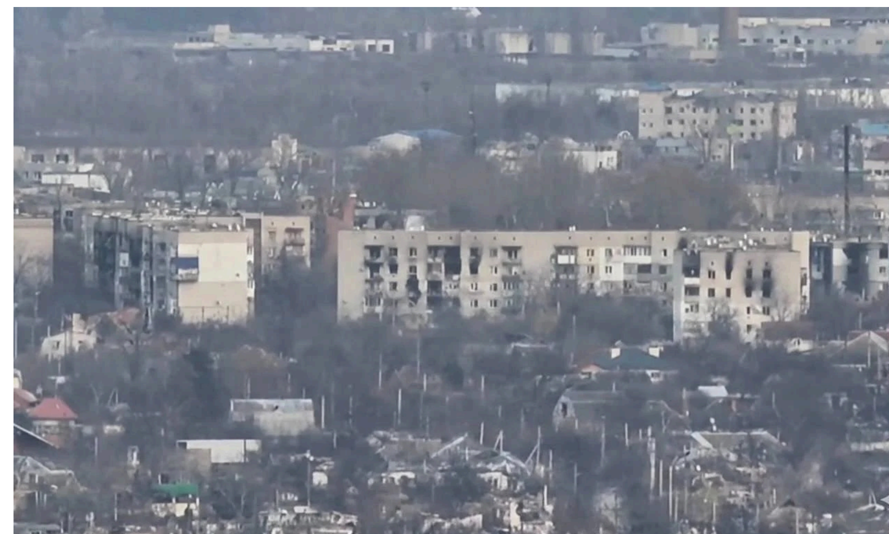
Так зараз виглядає місто.

- Зараз там російські паспорти вже й не видають, хоч на початку окупації їх нав'язували. Але наші й самі не хотіли їх брати. А якщо залишаєшся з українським паспортом, це величезний ризик. Не факт, що тебе взагалі випустять живим. Вбивства, фільтрація та повне беззаконня – це сьогоднішня реальність Олешок.