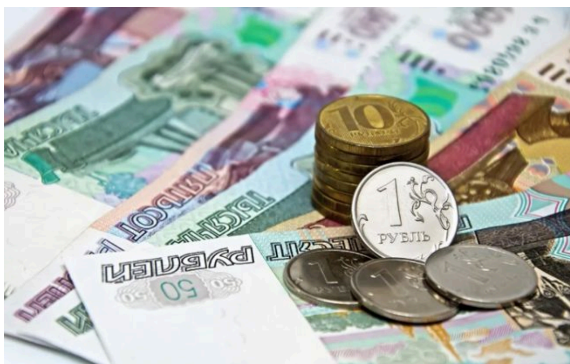
Фото: російський рубль обезцінюється все більше