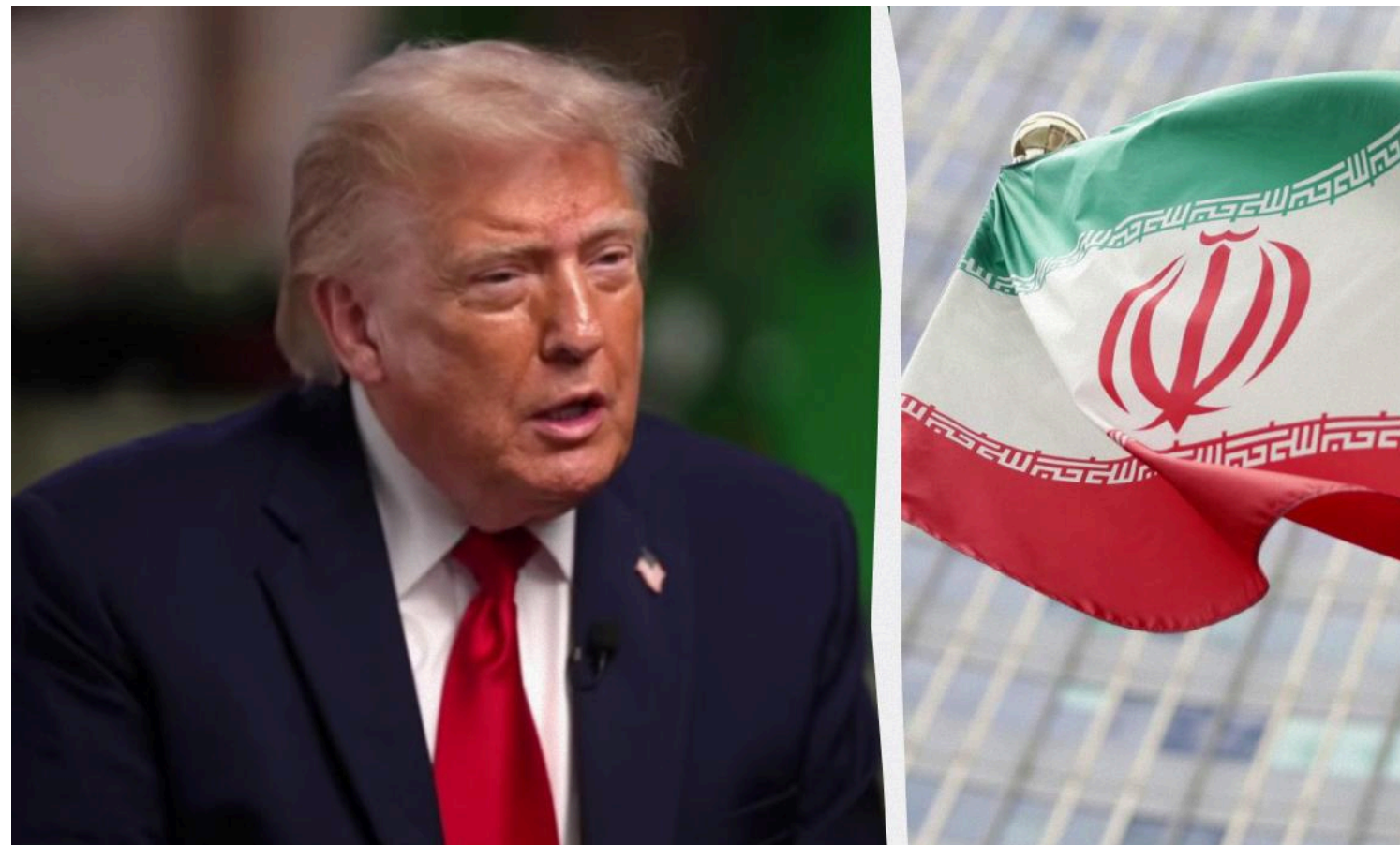
Трамп залишив найскладніші питання з Іраном на потім

Попередня домовленість передбачає лише 60 днів для врегулювання суперечок щодо ядерної програми Тегерана, санкцій та безпеки в регіоні.