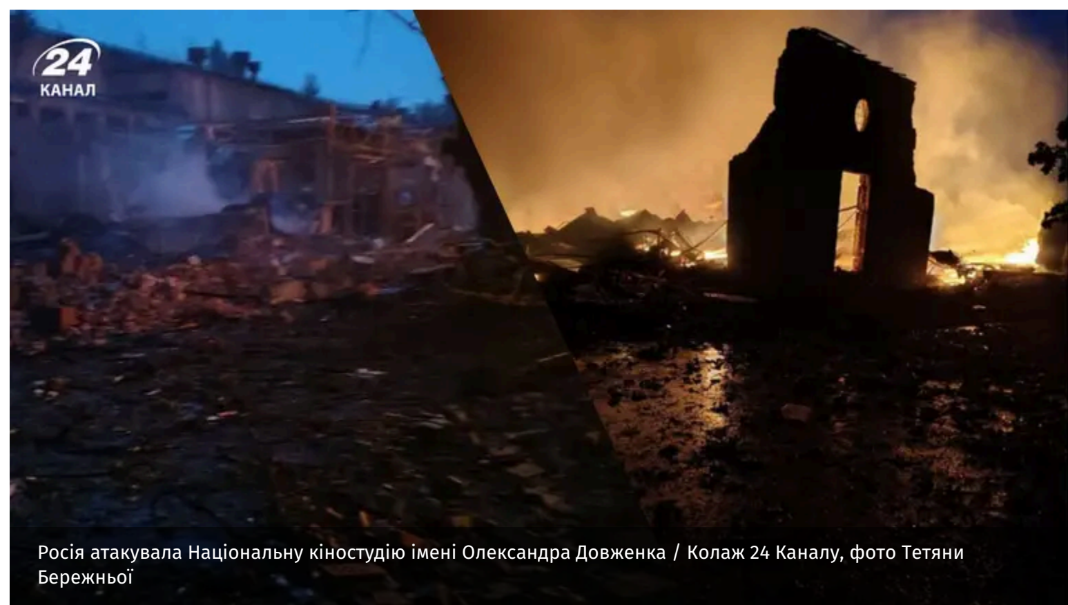
Росія атакувала Національну кіностудію імені Олександра Довженка

Росія у ніч на 15 червня здійснила ще один надзвичайно важкий злочин проти української культури. Вона атакувала Національну кіностудію імені Олександра Довженка в Києві.