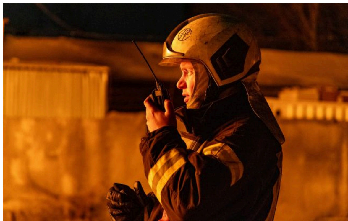
Фото: працівники ДСНС (Getty Images)