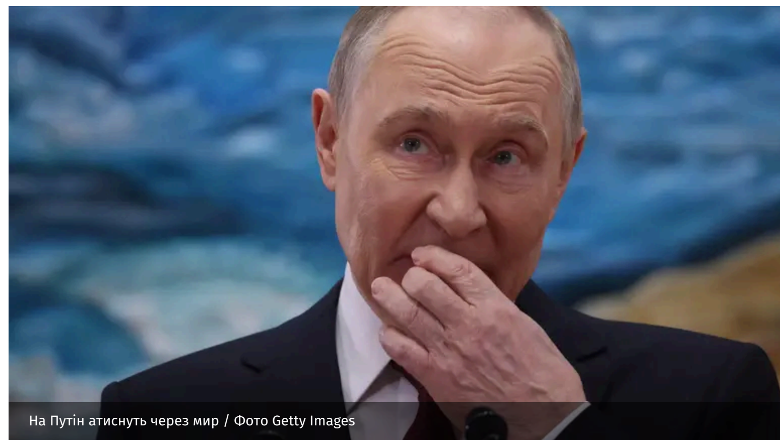
На Путін атиснуть через мир

Володимир Путін всіляко намагається ігнорувати заклики української влади до миру. Можливість переговорів між Україною та Росією восени залежатиме від того, наскільки успішно Сили оборони зможуть послабити російську логістику та військові спроможності.