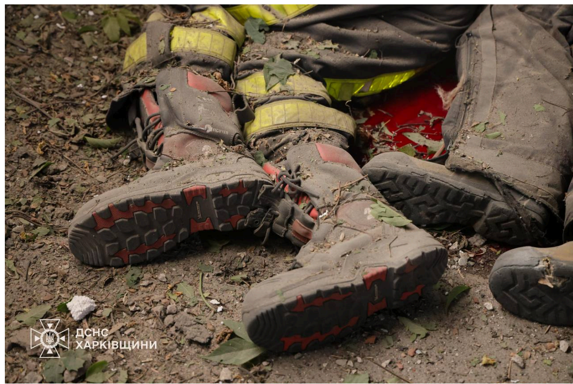
Фото: в Харкові загинули п'ятеро рятувальників під час гасіння пожежі

"Масована російська атака триває. Під головним ударом - Київ. Є значні руйнування цивільної інфраструктури. До ліквідації наслідків задіяні необхідні служби", - повідомив глава МВС та закликів українців перебувати в безпечному місці під час тривоги.