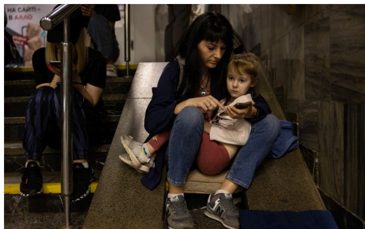
Фото: людей закликали перейти в укриття (Getty Images)

Розумій ситуацію на фронті через факти, а не чутки з РБК-Україна у Google