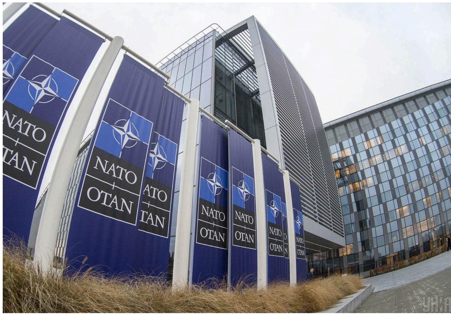
Майбутні війни торкнуться не лише фронту

Країни Альянсу можуть зіткнутися з ситуацією, коли кількість дронів і ракет, що запускаються противником, перевищить можливості існуючих систем ППО.