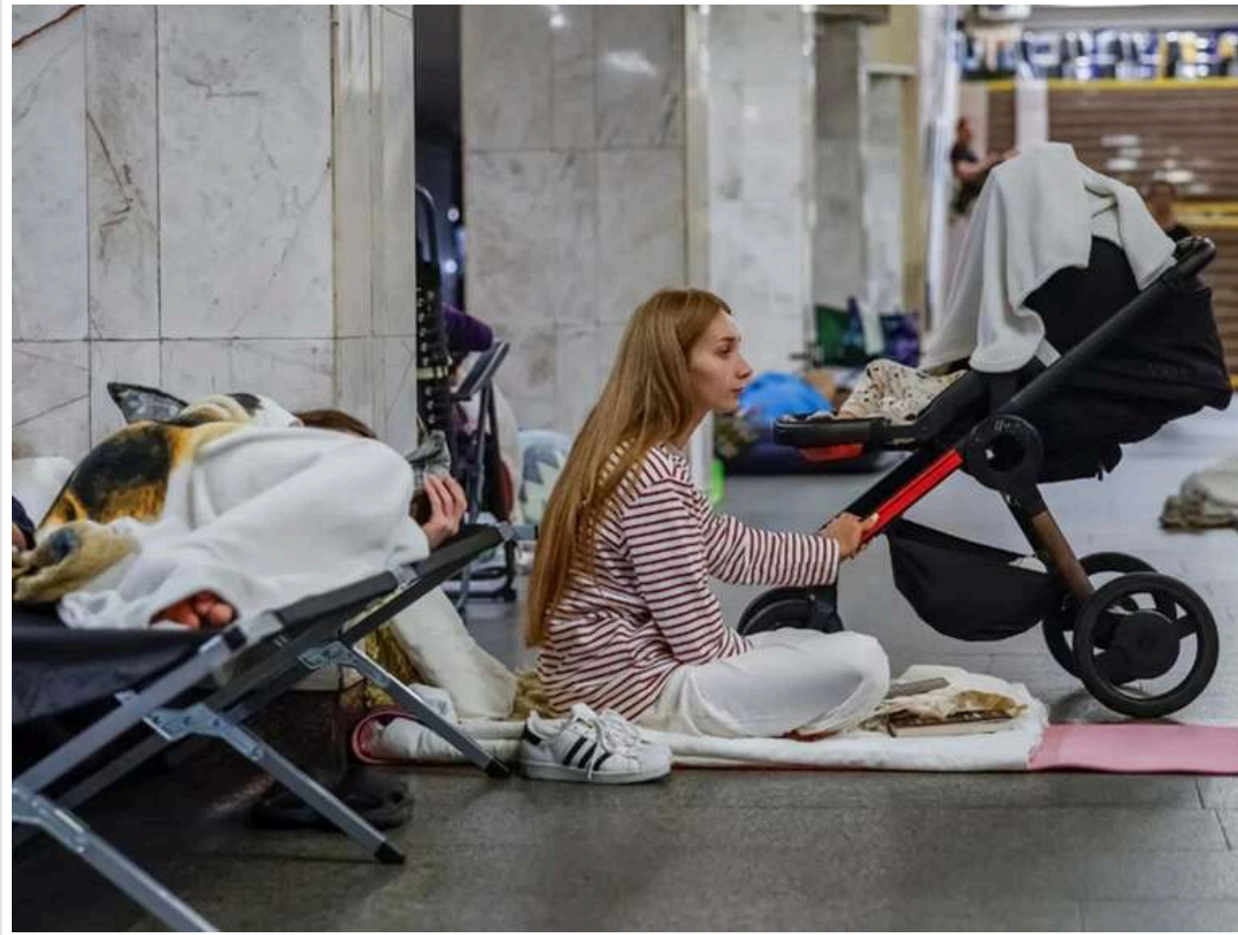
Через загрозу масштабного нічного обстрілу сотні киян спускаються на ночівлю в метро

У зв'язку із загрозою масштабного нічного обстрілу з боку російських окупантів, сотні мешканців Києва знову змушені готуватися до ночівлі на станціях столичного метрополітену.