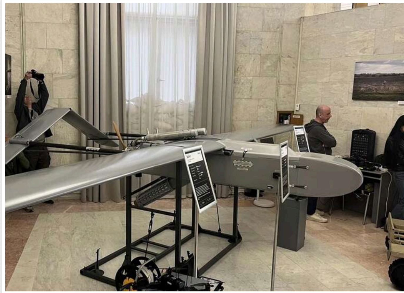
Дрони проти ракет: як українські безпілотники FP-2 та «Бегемот» перекривають логістику РФ на Чонгарському напрямку