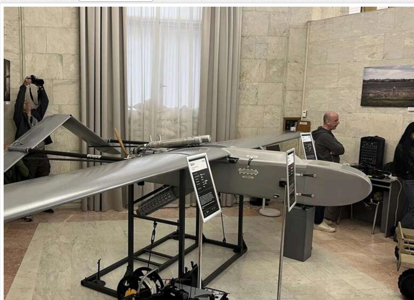
Дрони проти ракет: як українські безпілотики FP-2 та «Бегемот» перекривають логістику РФ на Чонгарському напрямку