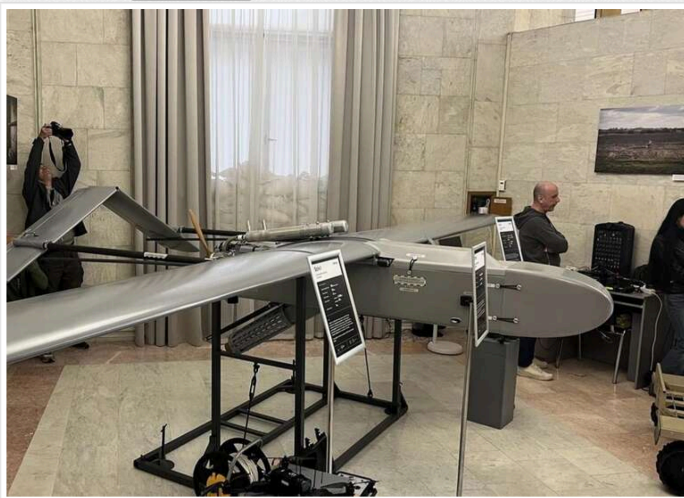
Дрони проти ракет: як українські безпілотники FP-2 та «Бегемот» перекривають логістику РФ на Чонгарському напрямку

Читати на руськом Додати як бажане джерело в Google