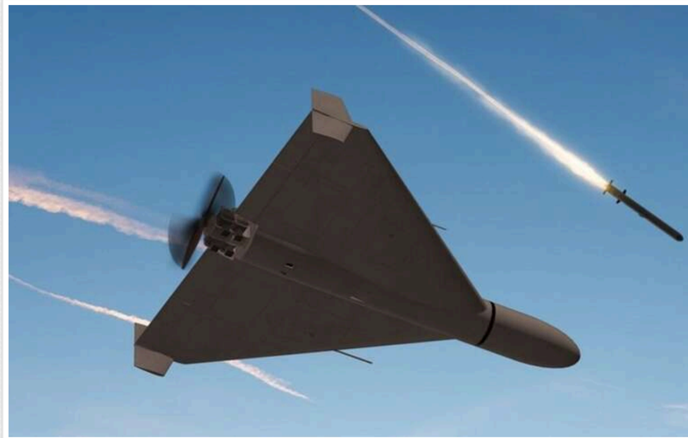
Загроза масованого удару: РФ задіяла Ту-160 та Ту-95МС, монітори попереджають про можливу атаку на Київ ракетами «Орешнік»

Читати на руськом Read in English Додати як бажане джерело в Google