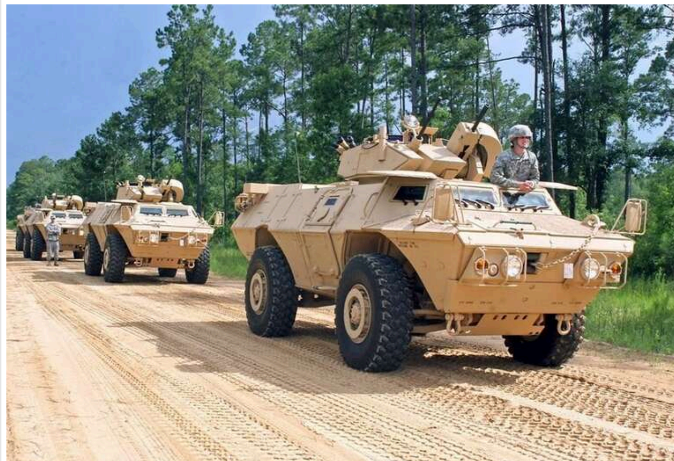
Спеціально для ЗСУ: Textron Systems відновлює виробництво бронемашин MSFV за контрактом на 163 мільйони доларів

Американська оборонна компанія Textron Systems розпочала виробництво 65 ударних бронемашин MSFV, призначених для Збройних сил України. Цей контракт є одним із найбільших замовлень на бронетехніку для Збройних сил України, він фінансується за програмою Ініціативи сприяння безпеці в Україні (USAI) і оцінюється у 163,4 мільйона доларів. Постачання планують завершити до 30 листопада 2028 року.