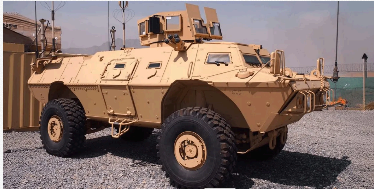
Бронемашина M1117

Примітно, що виробництво MSFV відновили вперше з 2019 року – спеціально для України. Спочатку ці машини розробляли для афганської кампанії. Українські військові вже мали досвід роботи з попередником – бронемашини M1117 передавали ЗСУ у 2024 році.