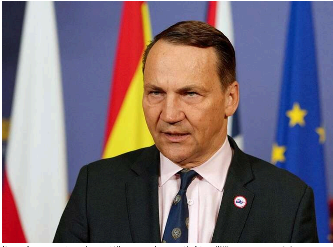
Сікорський назвав головні теми для зустрічі Навроцького з Трампом: східний фланг НАТО та анулювання візи Зьобро

Президент Польщі Кароль Навроцький під час зустрічі з президентом США Дональдом Трампом має обговорити посилення східного флангу НАТО. Також йому радять вимагати скасування американської візи ексміністра юстиції Збігнева Зьобро, який переховується в США.