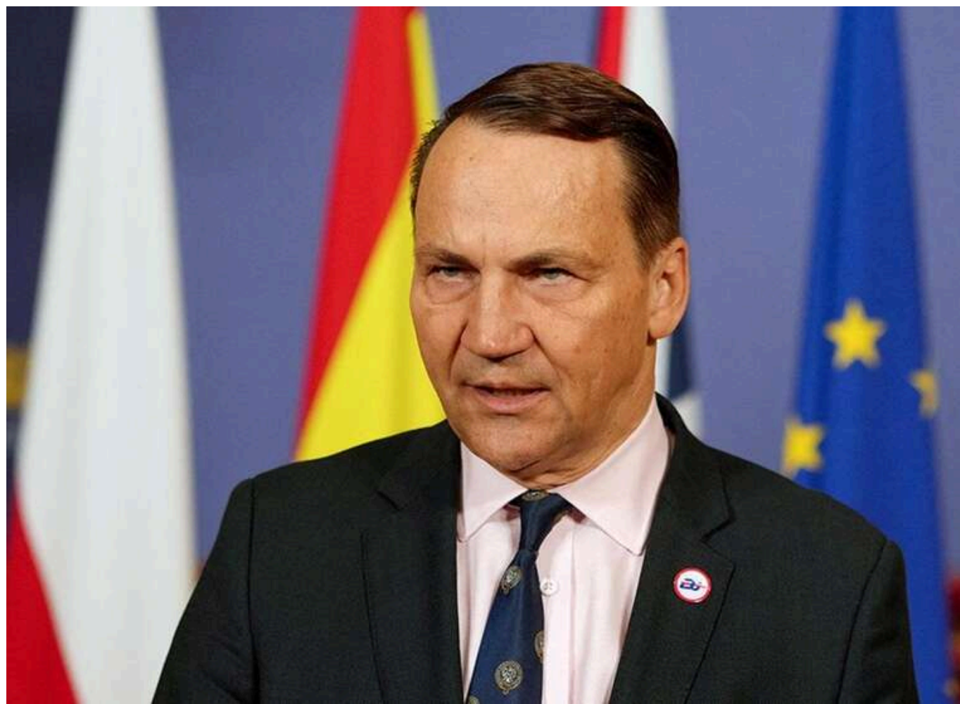
Сікорський назвав головні теми для зустрічі Навроцького з Трампом: східний фланг НАТО та анулювання візи Зьобро

Президент Польщі Кароль Навроцький під час зустрічі з президентом США Дональдом Трампом має обговорити посилення східного флангу НАТО. Також йому радять вимагати скасування американської візи екміністра юстиції Збігнева Зьобро, який переховується в США.