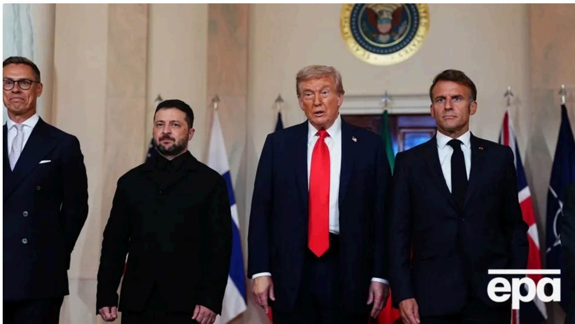
За даними ЗМІ, Трамп може зустрітись із Зеленським 16 червня, а наступного дня – повечеряти з Макроном

Україна та її європейські союзники під час саміту лідерів "Групи семи" (G7) у Франції планують переконати президента США Дональда Трампа допомогти з озброєнням для стримування Росії, зберегти фінансову підтримку Києва, а також посилити санкційний тиск на Росію. Про це 14 червня інформує Politico із посиланням на джерела.