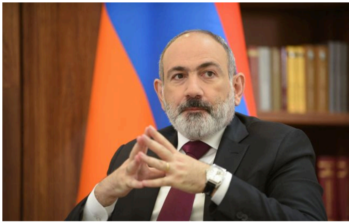
Фото: Нікол Пашинян