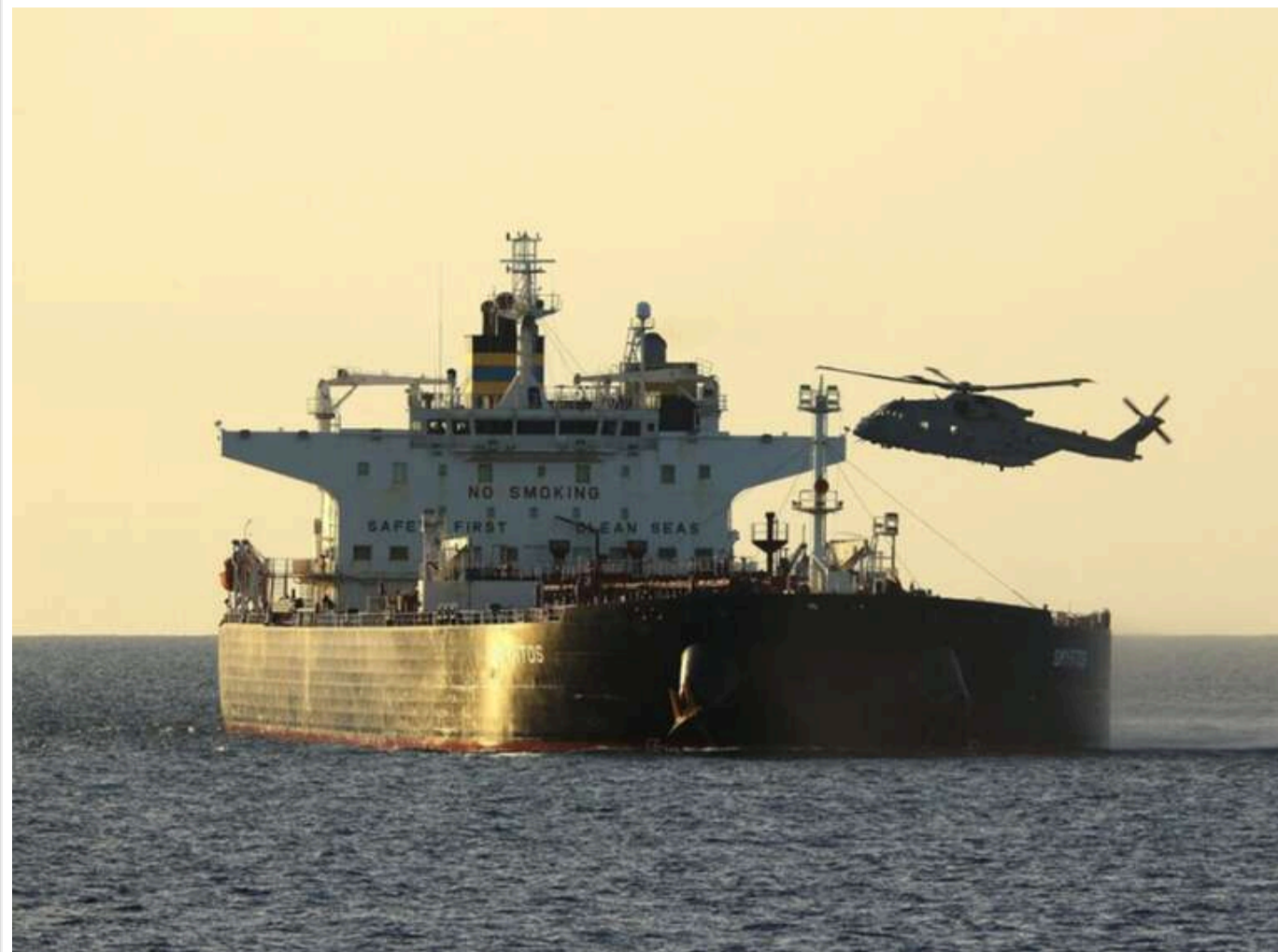
The Insider: Після затримання танкера РФ інші судна «тіньового флоту» почали змінювати маршрути в районі Ла-Маншу

Після того як Велика Британія перехопила нафтовий танкер "тіньового флоту" РФ, який намагався пройти через Ла-Манш, низка інших нафтових танкерів почала змінювати свої маршрути.